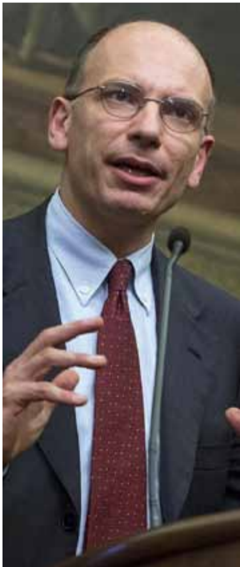
(Servizio a pagina 6)

Il leader del M5S insorge contro il ddl presentato al Senato: "Se passa disertiamo il voto"