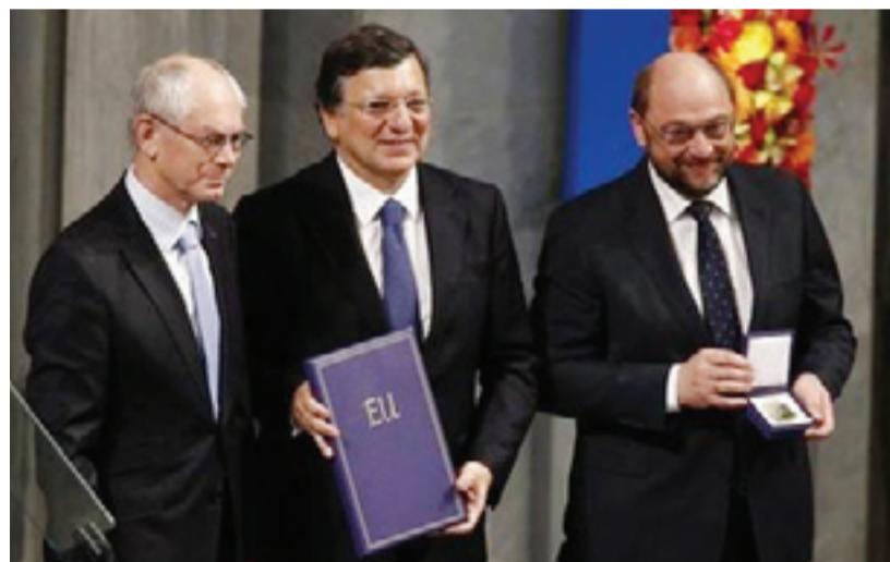
(Servizio a pagina 7)