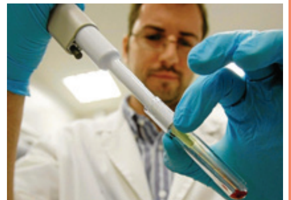
(Servizio a pagina 2)