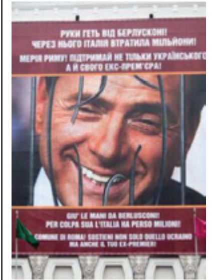
Foto Tymoshenko a Roma, Ucraina espone Berlusconi dietro le sbarre

ROMA - Non s'è fatta attendere la risposta ucraina alla manifestazione di solidarietà che Roma ha dedicato a Yulia Tymoshenko, esponendo al Campidoglio la sua gigantografia. La città di Kharkiv, che per inciso è quella in cui l'ex premier ucraina sconta una pena detentiva a sette anni, ha esposto una gigantografia che raffigura l'ex presidente del Consiglio italiano Silvio Berlusconi, sorridente dietro le sbarre.