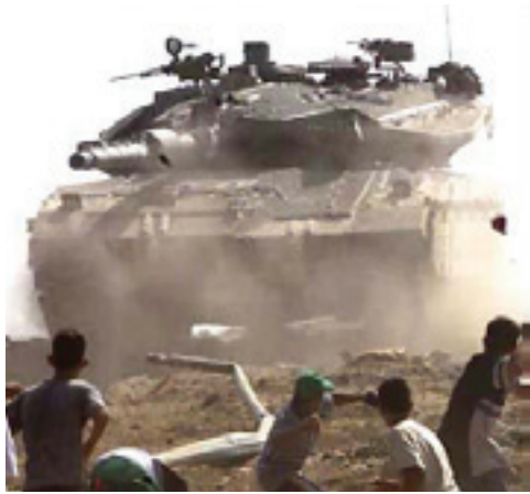
(Servizio a pagina 8)