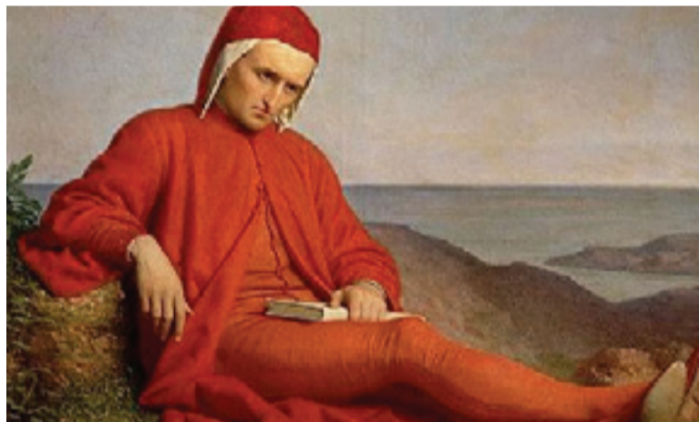
(Servizio a pagina 2)