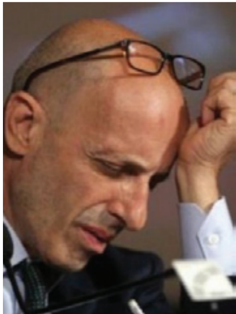
(Servizio a pagina 6)