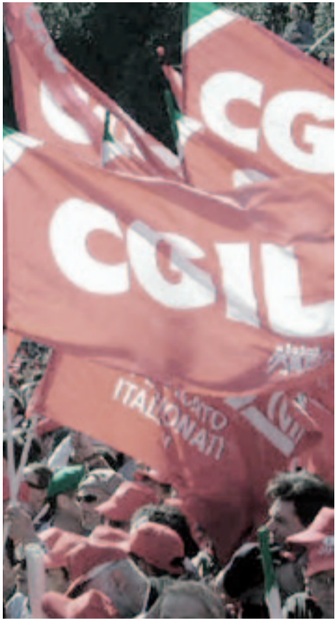
(Servizio a pagina 5)

Il conclave ministeriale, dopo la pausa estiva, è durato nove ore, quasi un record per Palazzo Chigi