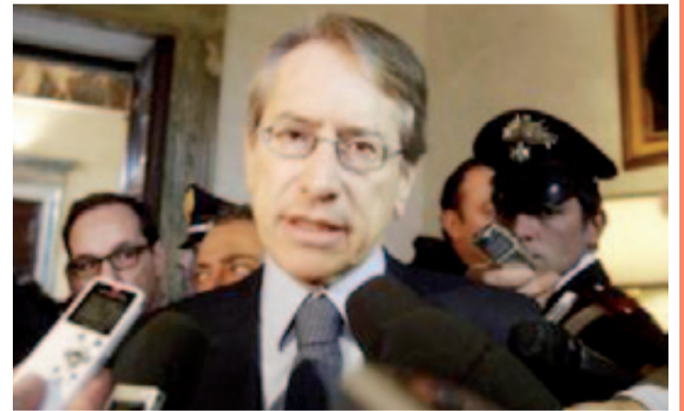
(Servizio a pagina 2)