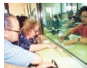
(A pagina 2)