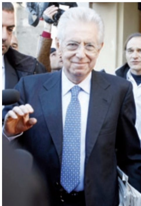
(Servizio a pagina 6)