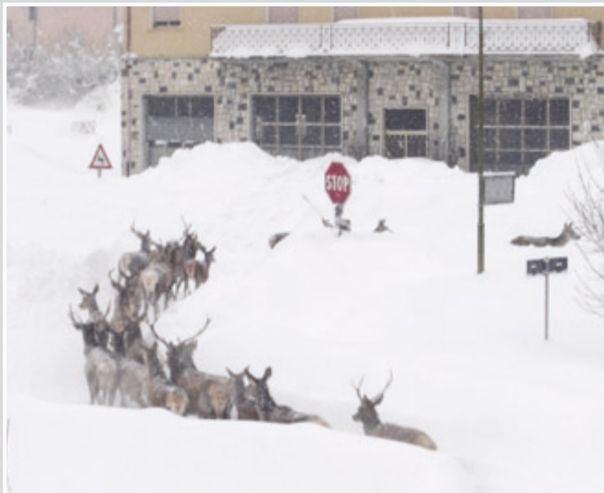
Cerbiatti e cervi nel centro di Alfedena (L'Aquila), in una immagine di domenica scorsa

SABATO: Udine, Venezia, Milano, Genova, Bologna, Rimini, Firenze, Perugia, Alghero, Olbia e persino Roma.