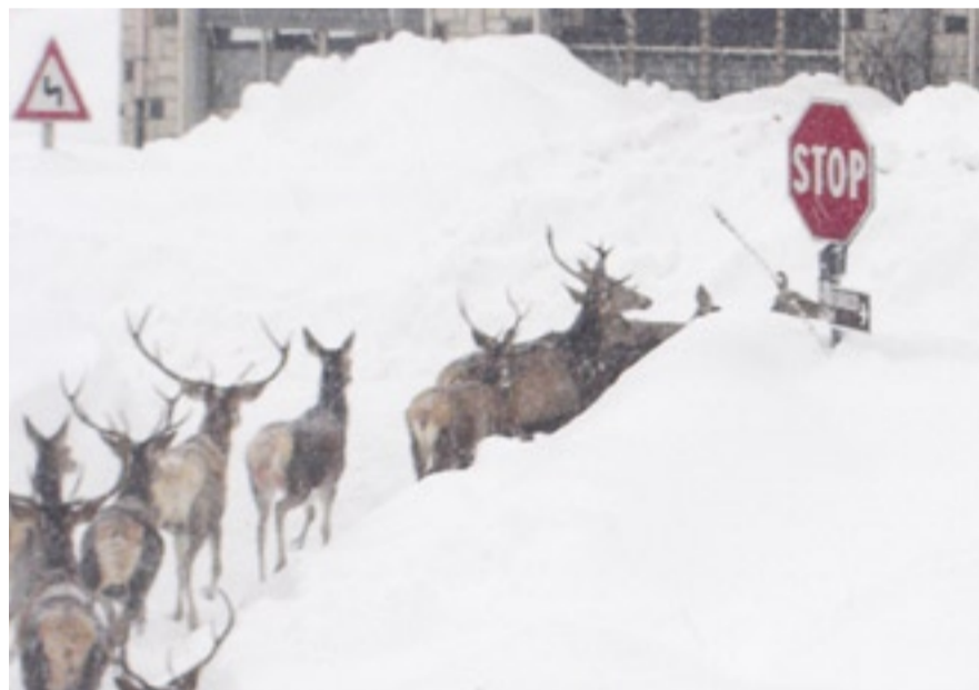
Cerbiatti e cervi nel centro di Alfedena (L'Aquila).