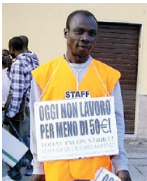
(Servizio a pagina 7)